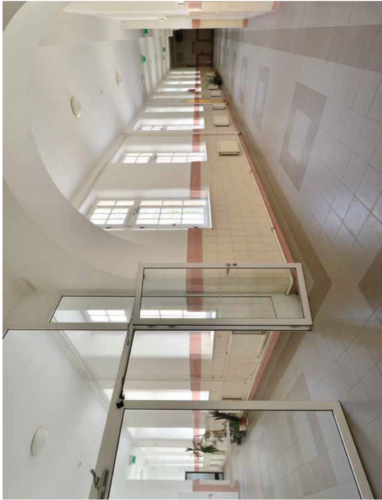
E folyosók látták a történelem viharait

hatását gyakorolják az emberre... ahol ilyen aprólékoságra kiterjed a figyelem, ott bent annál erősebben lüktet a gyermekvilág és a kultúra szervezete.” Az alig elkészült létesítményt az 1930-ban vehette újra birtokba a házat. Tizenkét év múlva, 1942-ben azonban újra költözni kellett, mert az épületbe a Damjanich Polgári Fiúiskola költözött. Bár kevesen tudnak róla, a ház a II. világháború végén náci katonák szálláshelye volt. A háború befejeződése után lelkes pedagógusok, szülők